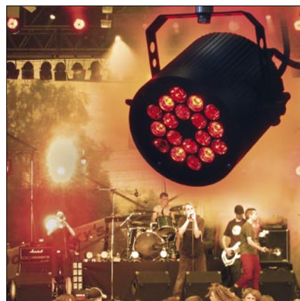
Obr. 5. Světlo SpectraWow!

Bodový (spot) světlo LED SpectraWow! s fascinujícím barevným spektrem je ideální pro vybavení televizních a filmových studií (obr. 5).