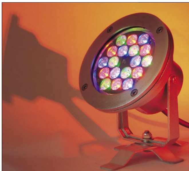
Obr. 4. Světlo LED RGB SpectraPoolpo

opery ve Vídni, splňuje díky vybavení technikou soc® náročné požadavky na stmívatelný systém LED profesionálního scénického osvětlení. V tomto zařízení je zabudován větrák s digitálním sledováním teploty (obr. 2 a 3).