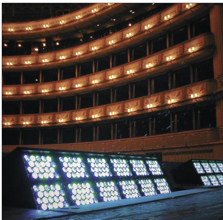
Obr. 2. Svítidla SpectraLimeled zabudovaná v pódii Státní opery ve Vídni