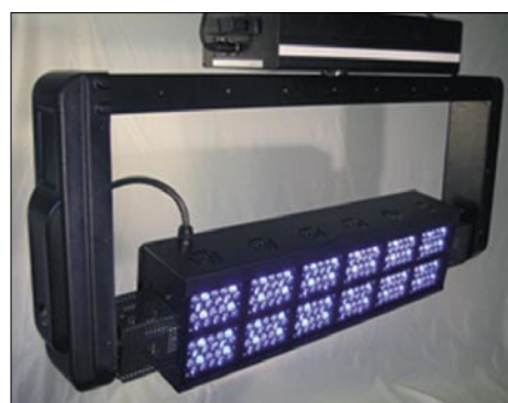
Obr. 3. Scénické osvětlovací zařízení SpectraLimeled